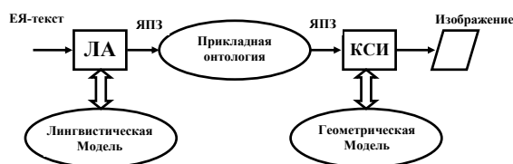
Рисунок 1 – Схема-схема системы LAT&CSI

Такой выбор схемы определен проектом, интегрирующим системы анализа/синтеза ЕЯ-текста и изображений на основе общей предметной онтологии [Khakhalin et al., 2012].